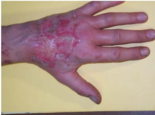
Via e-Mail empfangenes Bild einer Verbrennungswunde aus dem Pazifik 1997

Eine neue Ära wurde schließlich durch die Bildübertragung eingeläutet. 1997 erreichte Cuxhaven das erste Bild per e-mail. Die Möglichkeit der Bildübertragung kann man nicht hoch genug einschätzen.